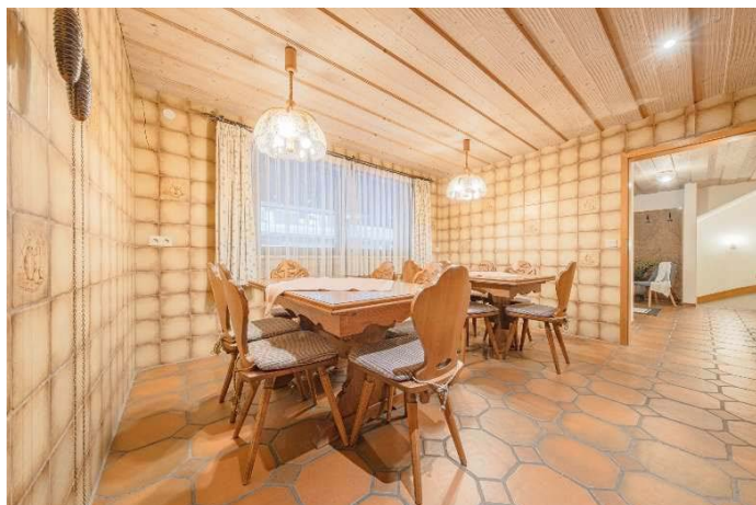
Frühstücksraum im Erdgeschoss